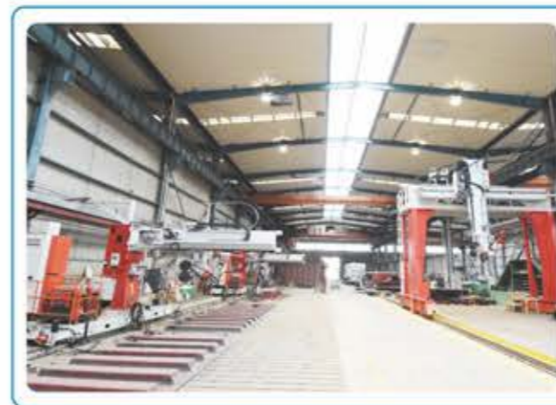
● 大型变压器油箱焊接机器人工作站