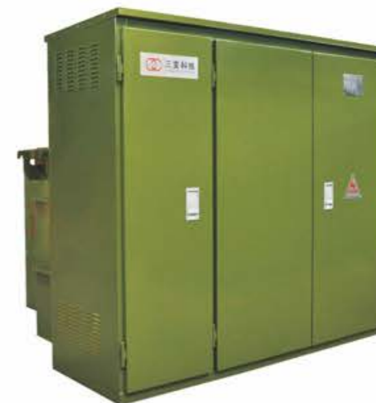
组合式变压器（美变）