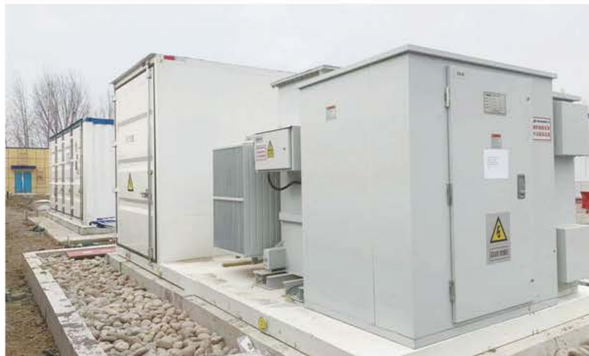
储能用组合式变压器（美变）