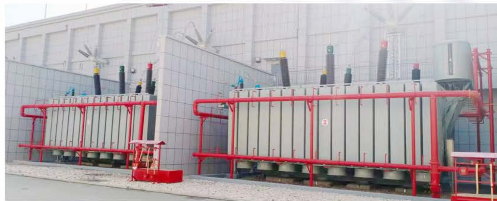
在山东万华化学工业园运行的SFSZ-240000/220