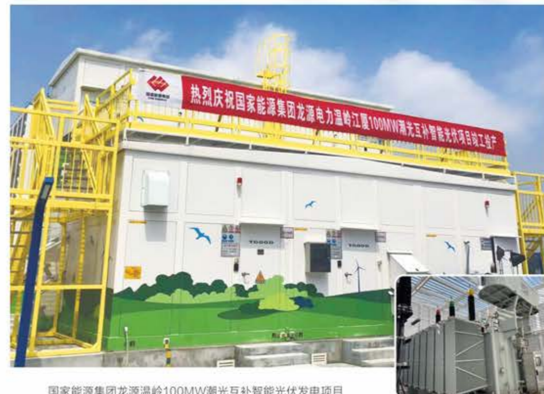
国家能源集团龙源温岭100MW潮光互补智能光伏发电项目