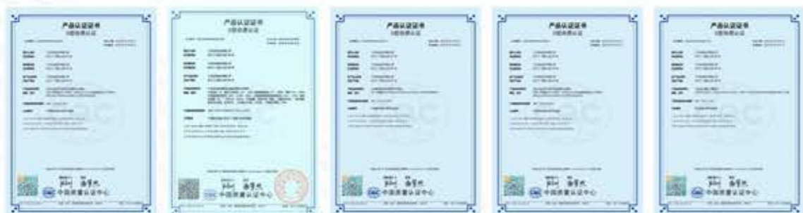
GCS 低压抽出式开关柜证书 JP型 户外低压综合配电箱证书 JXF型 动力配电箱证书 MNS 低压抽出式开关柜证书 XM 非金属计量箱证书