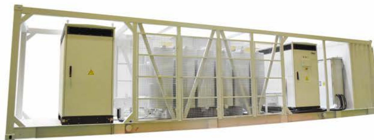
新能源用油浸式电力变压器