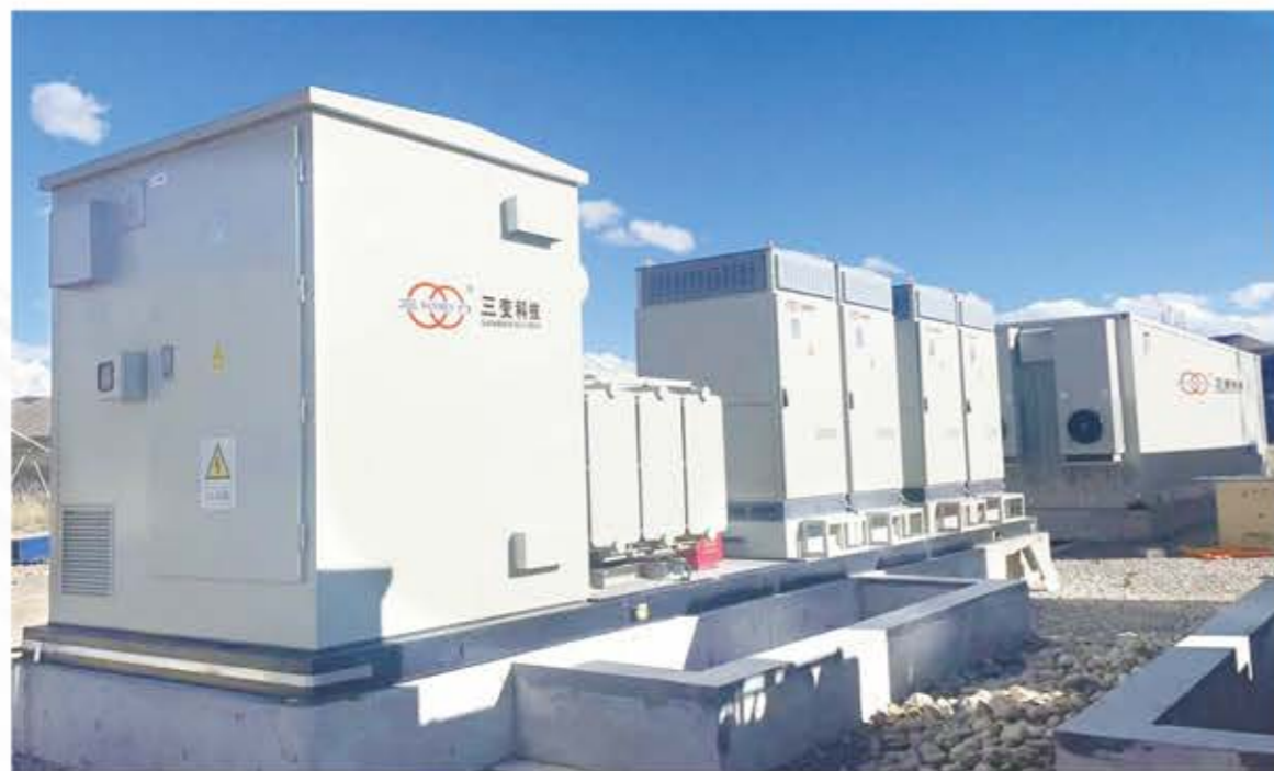
储能用组合式变压器（华变）用于西藏项目

具体技术参数详见公司网站。网址： http://www.sanbian.cn 技术部门联系电话：0576-89319962 售后服务联系电话：0576-89319289