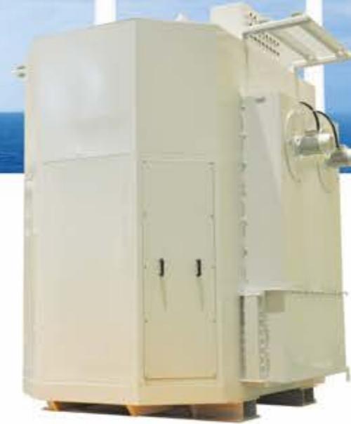
海上风力发电用干式变压器