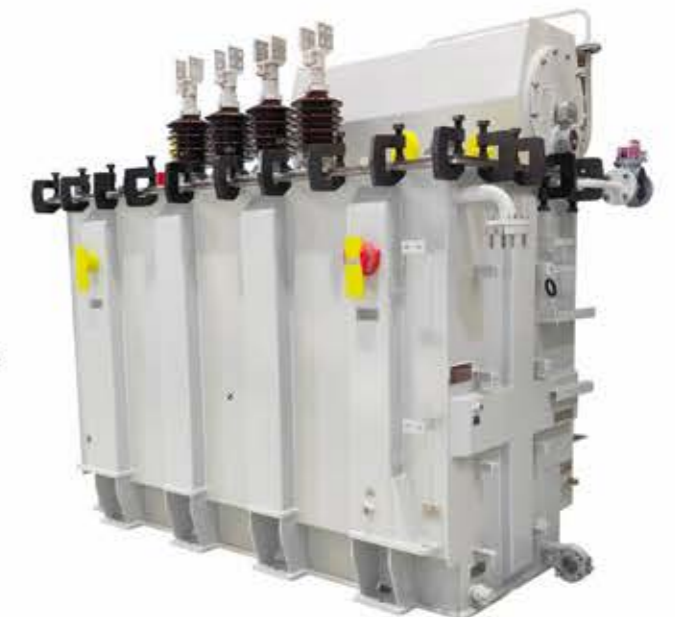
海上风力发电用电力变压器

具体技术参数详见公司网站。网址： http://www.sanbian.cn 技术部门联系电话：0576-89319962 售后服务联系电话：0576-89319289