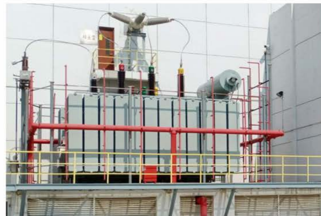
在山东万华化学工业区运行的SZ-120000/110

具体技术参数详见公司网站。网址： http://www.sanbian.cn 技术部门联系电话：0576-89319956 售后服务联系电话：0576-89319289