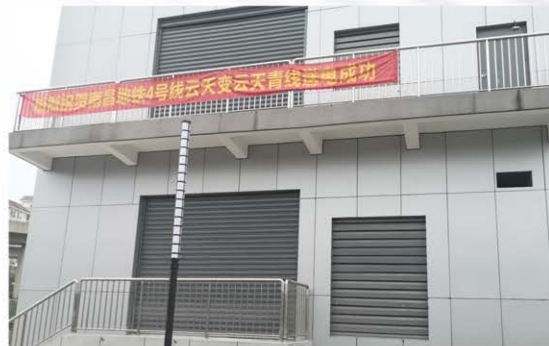
三变科技SCB-8000/35、SCB-9000/35、SCB-12000/35 批量产品为江西南昌地铁项目保驾护航