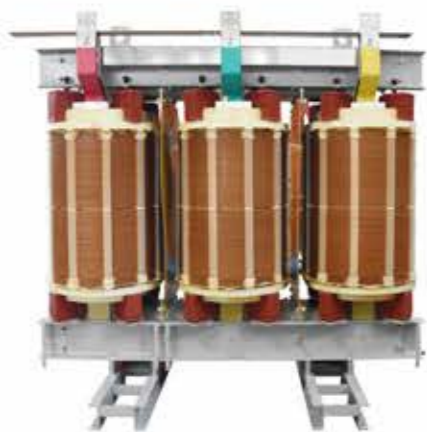
H级空气绝缘干式变压器