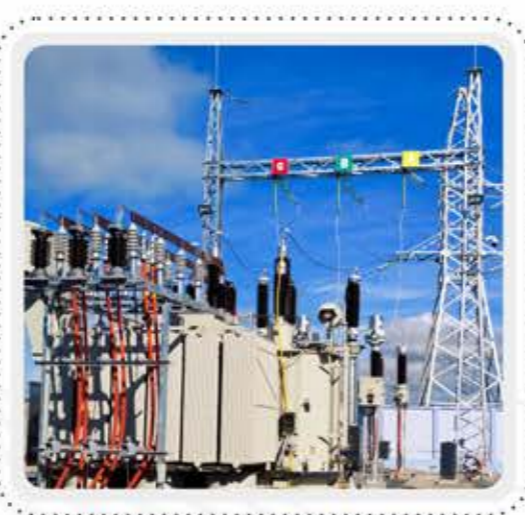
在阳光电源越南光伏发电运行的 SFZ-170000/220