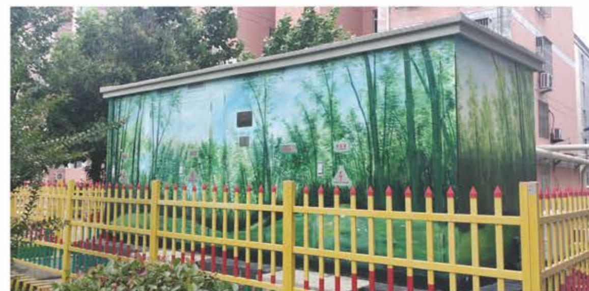
组合式变电站（欧变）

具体技术参数详见公司网站。网址： http://www.sanbian.cn 技术部门联系电话：0576-89319962 售后服务联系电话：0576-89319289