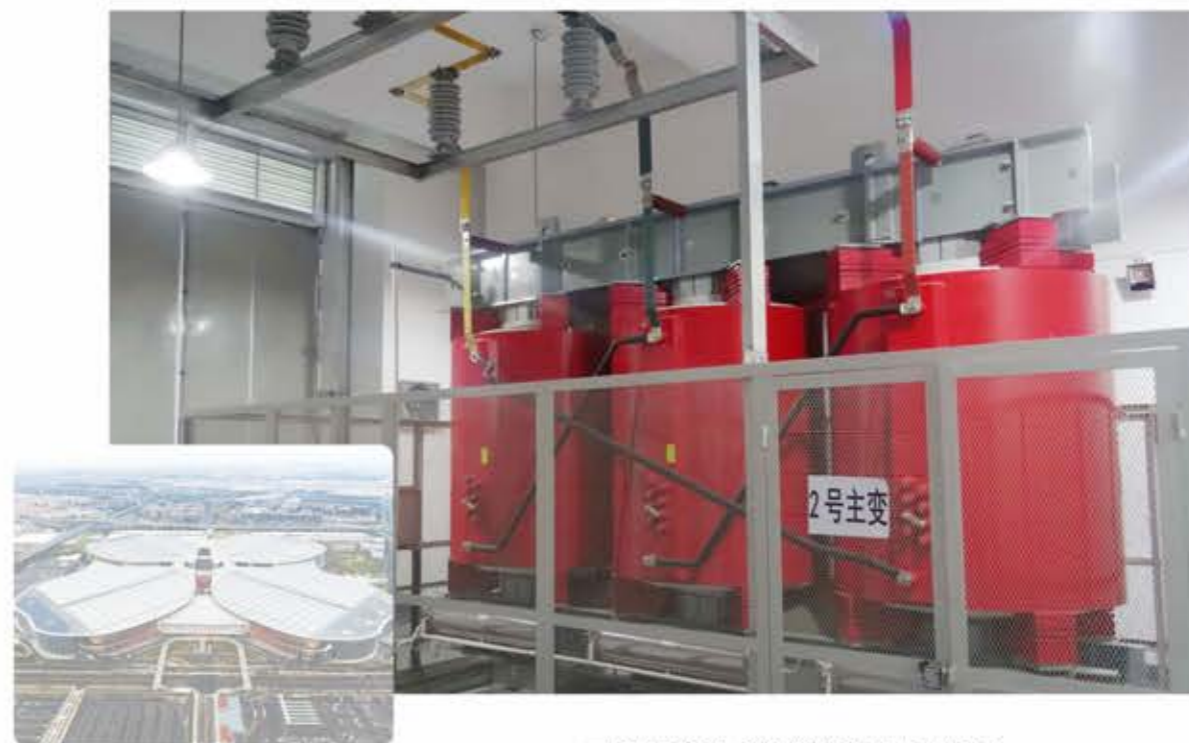
上海市国家会展中心