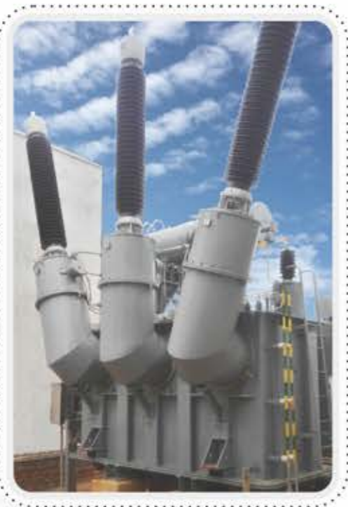
在广西百色运行的 BKS-15000/220电抗器