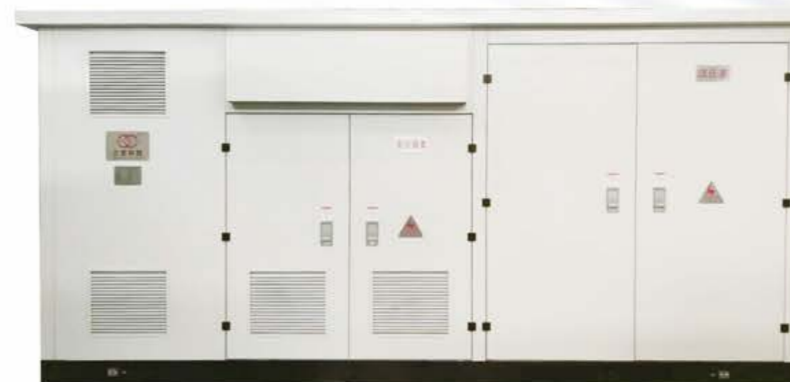
光伏发电用组合式变电站（欧变）