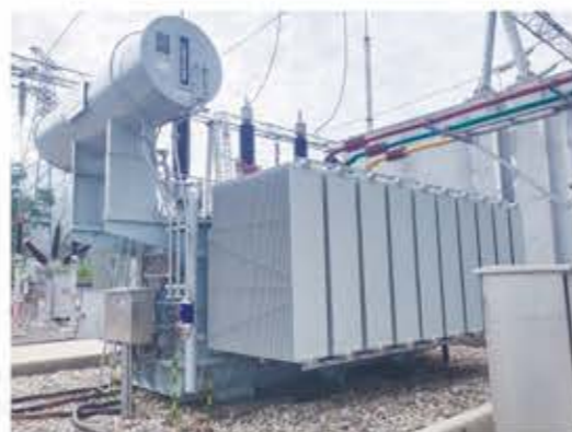
在山西龙源风电场运行的SZ-90000/110