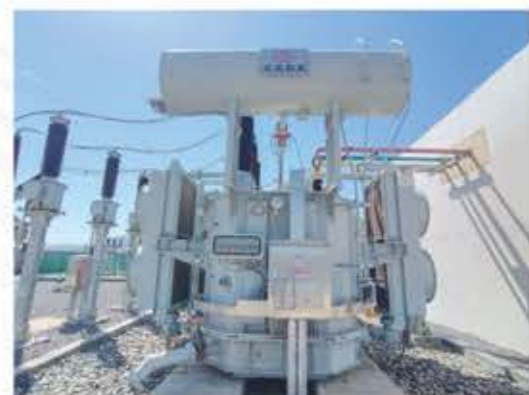
在中科嘉业海原高崖200MWp光伏复合发电项目中运行的SFPZ-200000/110