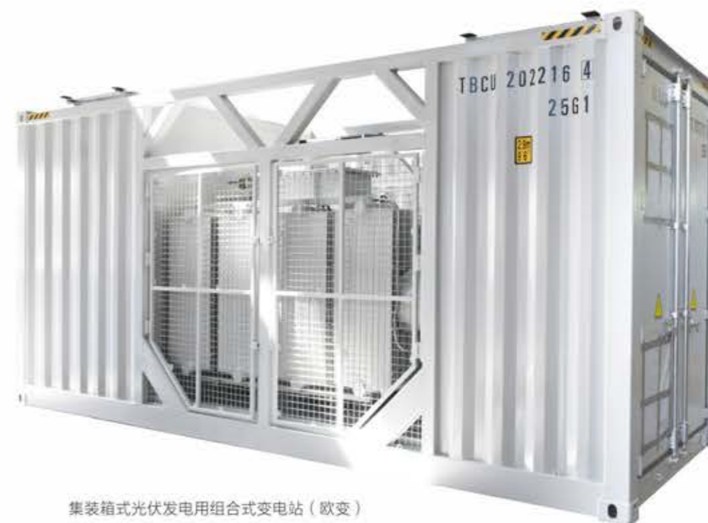
集装箱式光伏发电用组合式变电站（欧变）

具体技术参数详见公司网站。网址： http://www.sanbian.cn 技术部门联系电话：0576-89319962 售后服务联系电话：0576-89319289