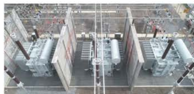
在国网金华芝堰变电站运行的 ODFS-334000/500

具体技术参数详见公司网站。网址： http://www.sanbian.cn 技术部门联系电话：0576-89319956 售后服务联系电话：0576-89319289