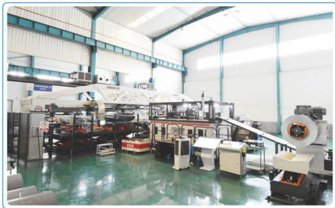
● 加拿大MTM大型铁心剪叠一体机 (XS800E)