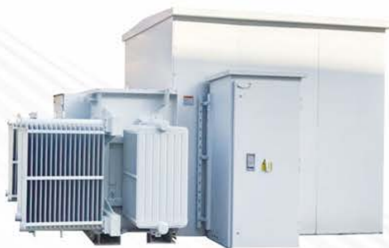
光伏发电用组合式变压器（华变）