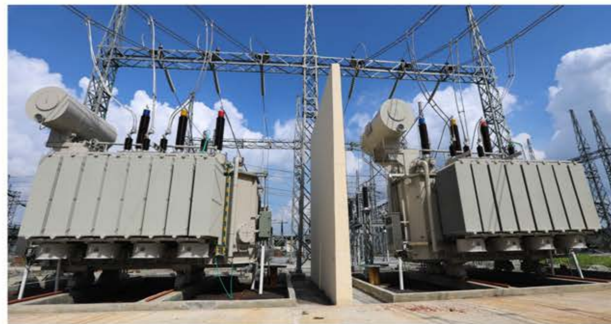
在孟加拉国家电网公司运行的OSFZ-300000/230

具体技术参数详见公司网站。网址： http://www.sanbian.cn 技术部门联系电话：0576-89319956 售后服务联系电话：0576-89319289