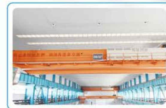
● 200t 行车