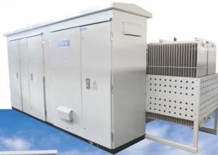
风力发电用组合式变压器（华变）