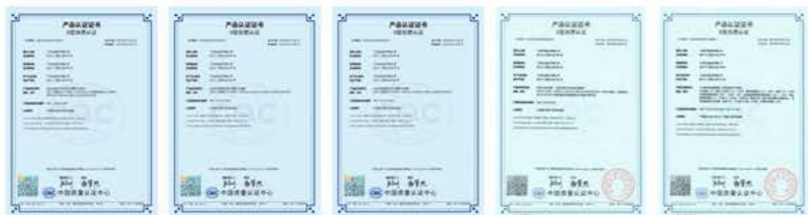
GCK型 低压抽出式开关柜证书 GGD3型 交流低压配电柜证书 GGD型 交流低压固定柜证书 GGJ 低压无功补偿柜证书 JP型 户外低压综合配电箱1证书