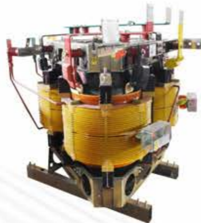
立体卷铁心空气干式变压器