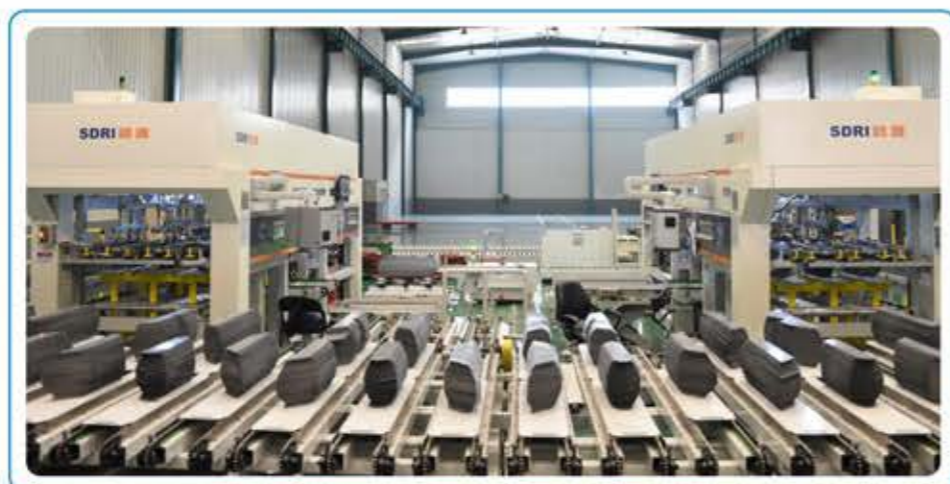
● 西安启源公司铁心智能生产线