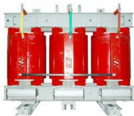
环氧树脂绝缘干式变压器