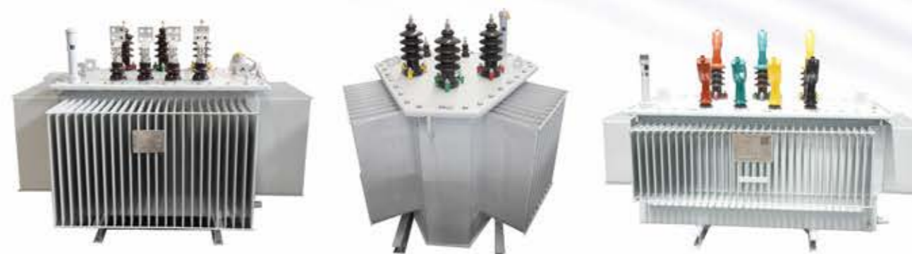
全密封配电变压器

具体技术参数详见公司网站。网址： http://www.sanbian.cn 技术部门联系电话：0576-89319956 售后服务联系电话：0576-89319289