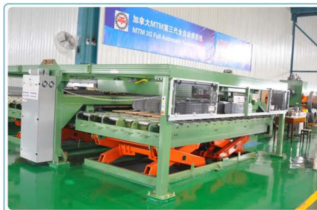
● 加拿大MTM全序列自动理料铁心横剪线 (XS600+P20)