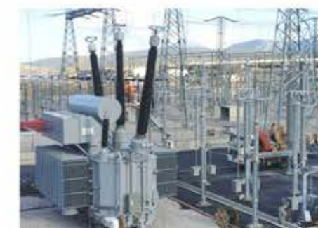
在希腊国家电网运行的 分裂变SFFZ-200000/400