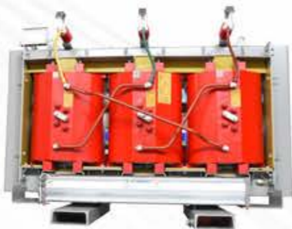
非晶合金铁心干式变压器