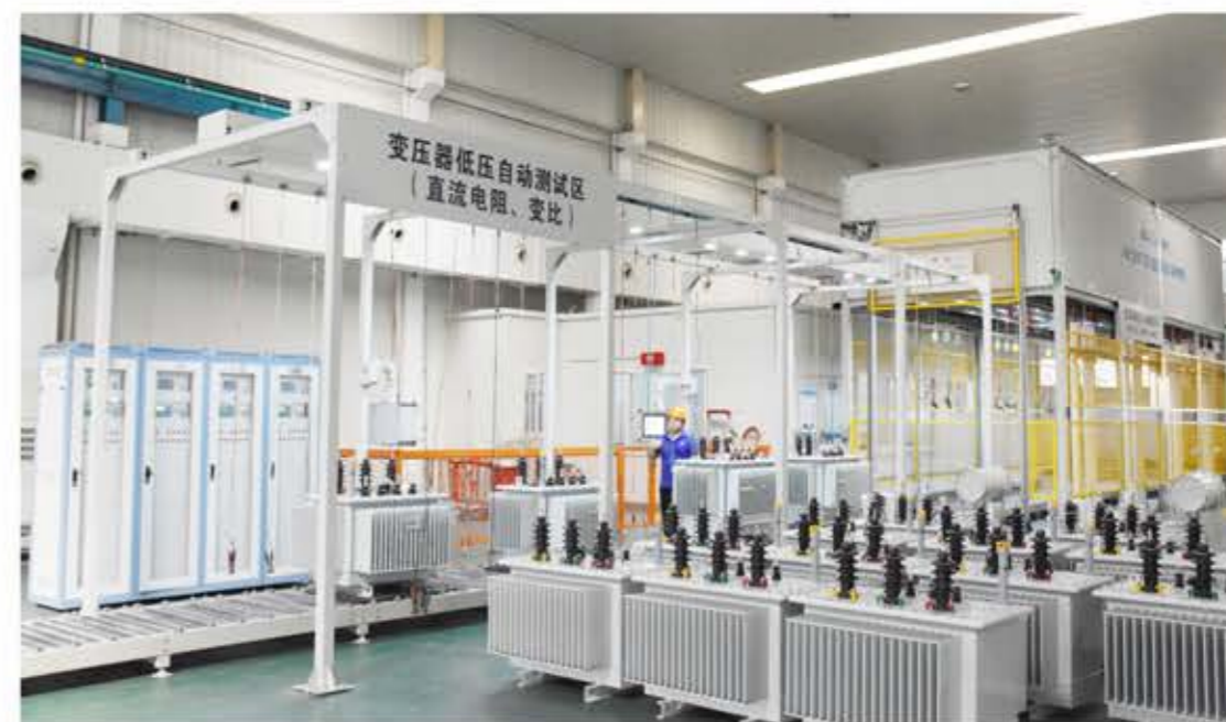
配电变压器试验中心

公司建立了500kV电力变压器的检测系统，具备了500kV级400MVA及以下单相自耦电力变压器、500kV级三相双绕组360MVA及以下电力变压器等电力配套设备产品的检测能力。设置了高压试验室、配变试验室、干变试验室、组合变试验室、理化实验室以及计量室，配备了一批素质高、技能好的质检队伍和72套先进的检测仪器，形成了“首检、自检、互检、专检”的质量保证体系。公司通过严格的无尘化管理和“6S”现场管理，给各产品流程提供了亮丽清洁的生产环境，保证了产品质量的稳定性。