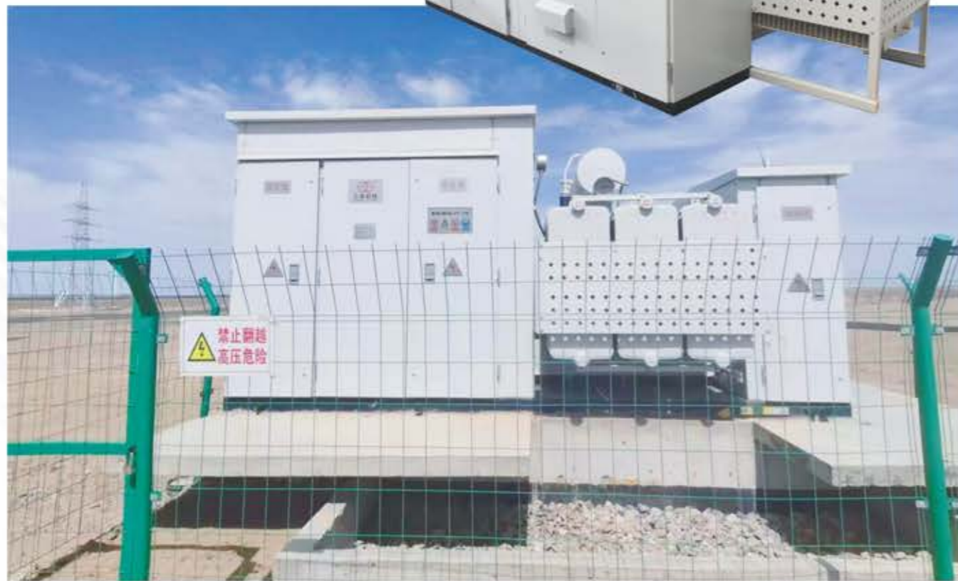
风力发电用组合式变压器（华变）