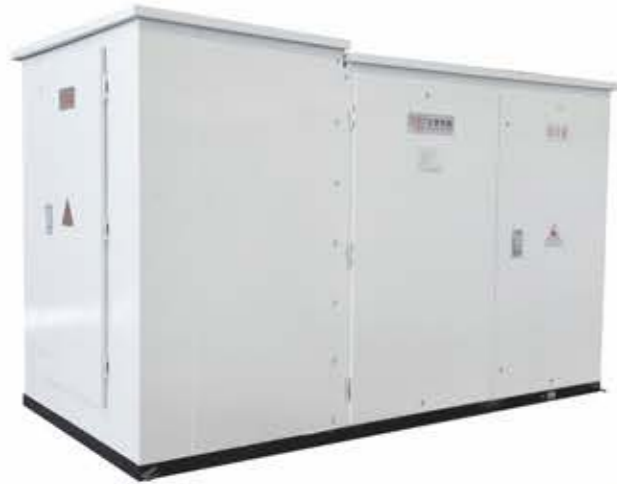
风力发电用组合式变压器（美变）