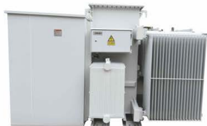
光伏发电用组合式变压器（美变）